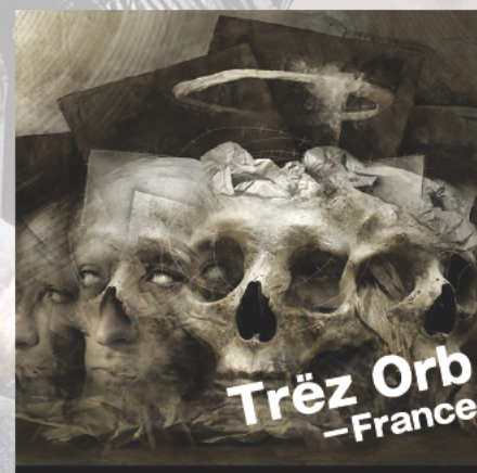
Tréz Orb -France