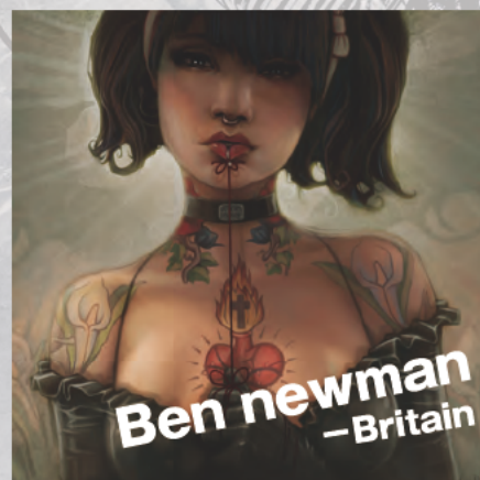
Ben Newman -Britain