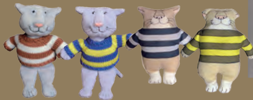
Edward Gorey Cat Gund Plush