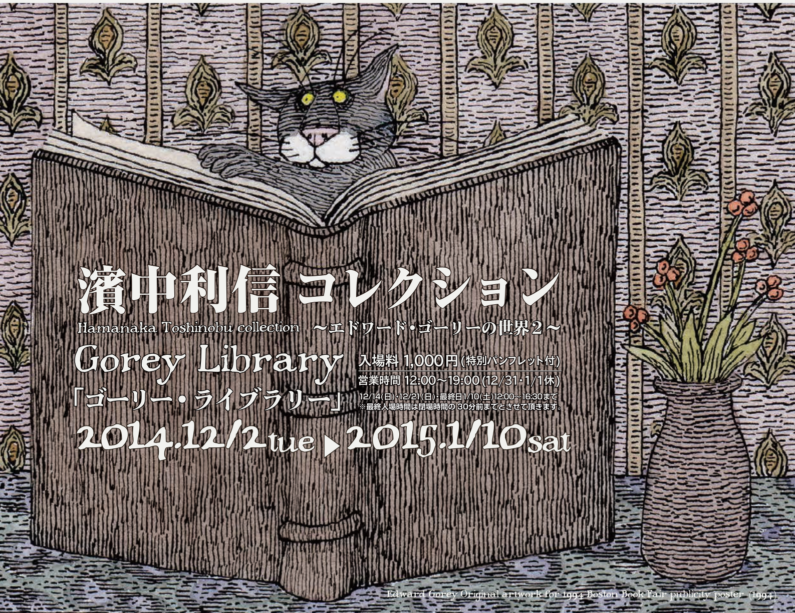
Edward Gorey Original artwork for 1994 Boston Book Fair publicity poster (1994)