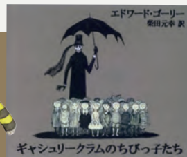
ギャッシュリーラムのちびっ子たち